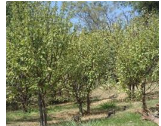
Individuos de Bursaria en época de lluvia

EL Jardín Etnobiológico UAGro (JEB-UAGro) preserva una colección de plantas vivas que contiene información científica y de conocimiento tradicional, útil en investigación, educación ambiental y en la conservación de la flora y cultura del estado de Guerrero.