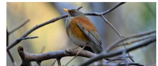
Individuo de una especie endémica del Oeste de la vertiente del Pacífico Mexicano: Turdus rufopalliatus . Ave residente del JEB-UAGro.

En el jardín se han registrado más de 80 especies de aves entre residentes y migratorias. Así como pequeños mamíferos y reptiles.