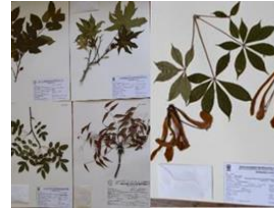
Ejemplares botánicos con registro de uso depositados en el Herbario UAGC.

El conocimiento tradicional, es un legado de nuestras comunidades originarias de Guerrero.